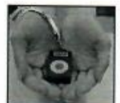
„Pánikgomb” Két segítségnyújtó készülék